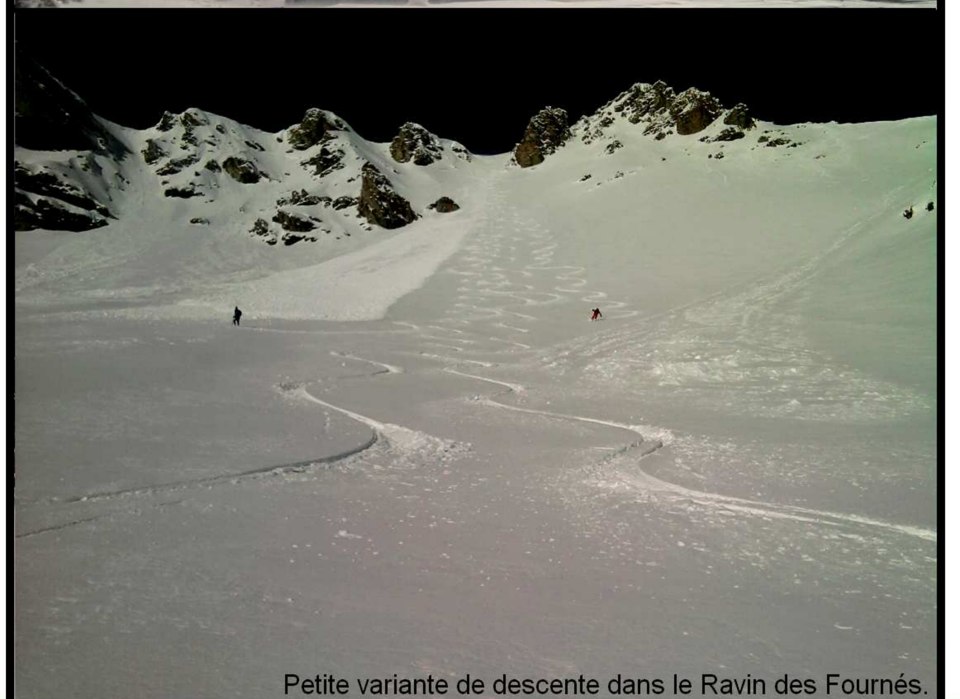
Petite variante de descente dans le Ravin des Fournés.