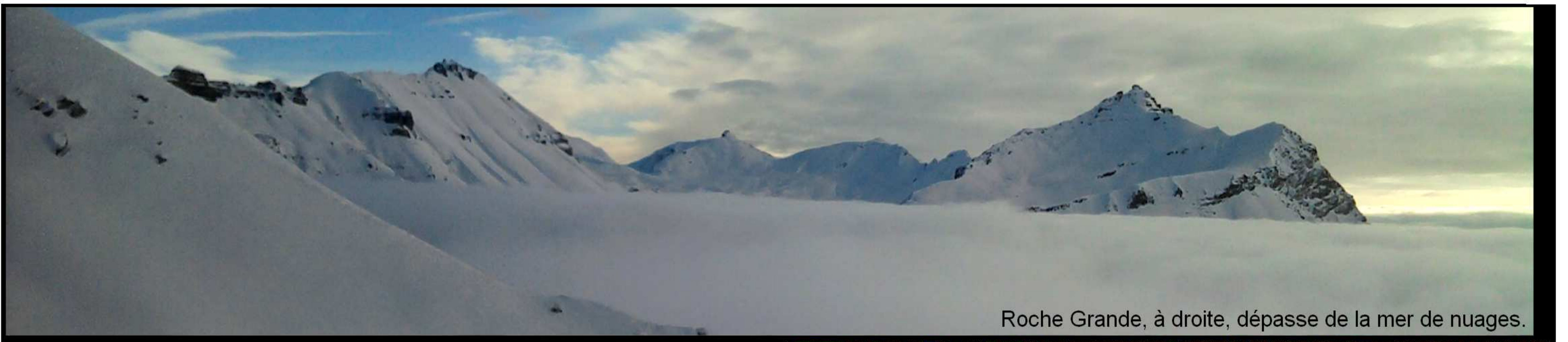
Roche Grande, à droite, dépasse de la mer de nuages.