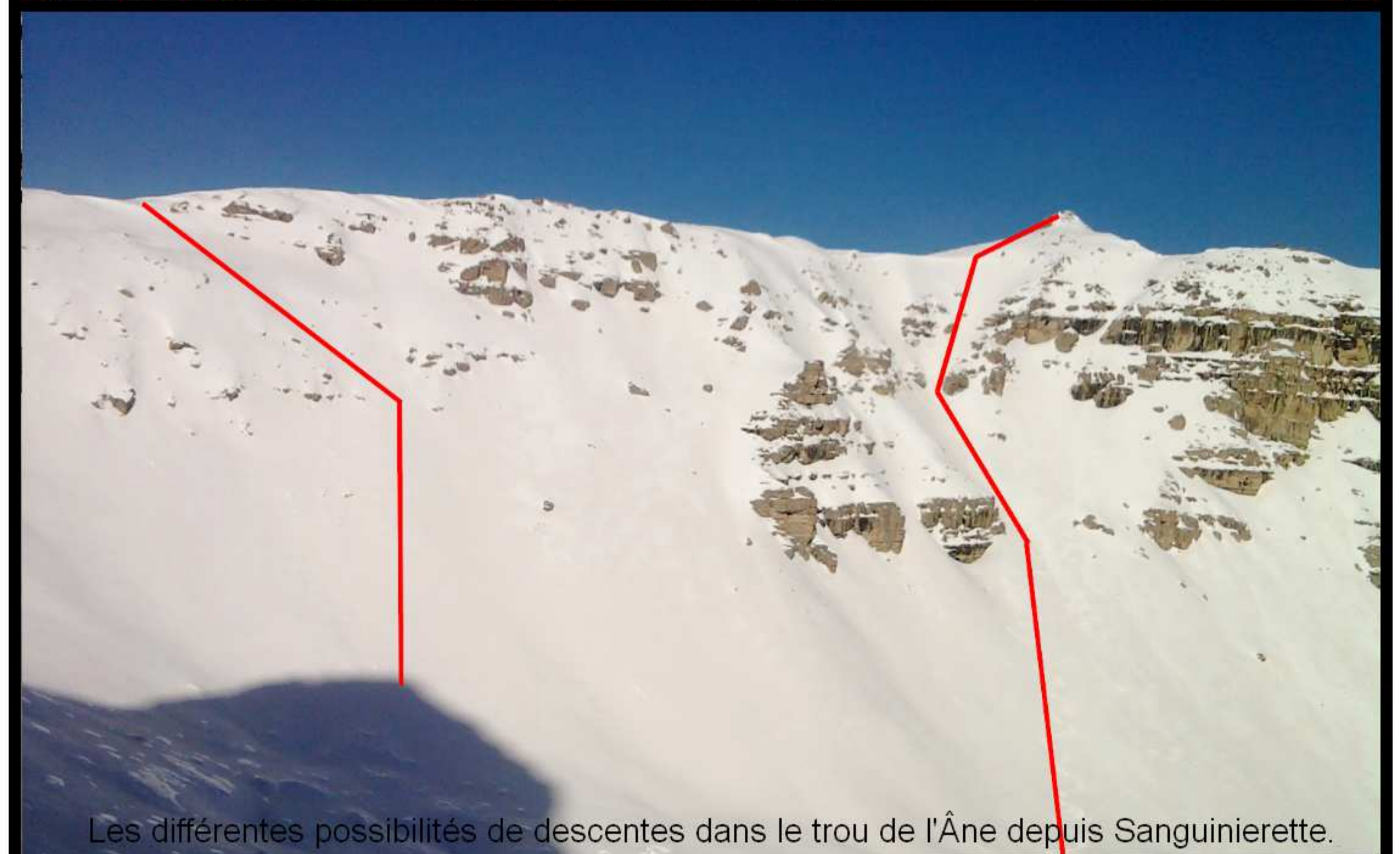
Les différentes possibilités de descentes dans le trou de l'Âne depuis Sanguineirette.

Adressez vous au gîte ou 06 31 83 56 08.