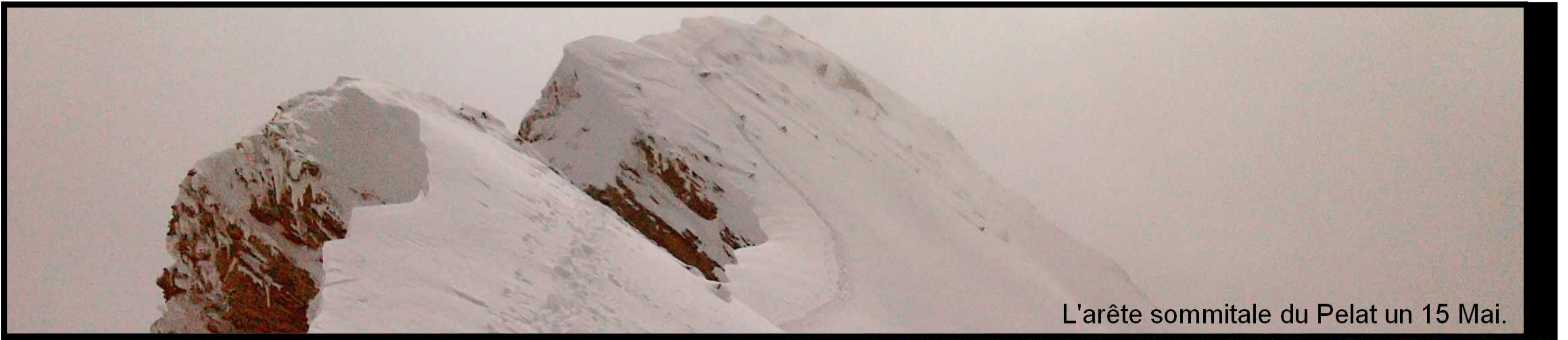
L'arête sommitale du Pelat un 15 Mai.