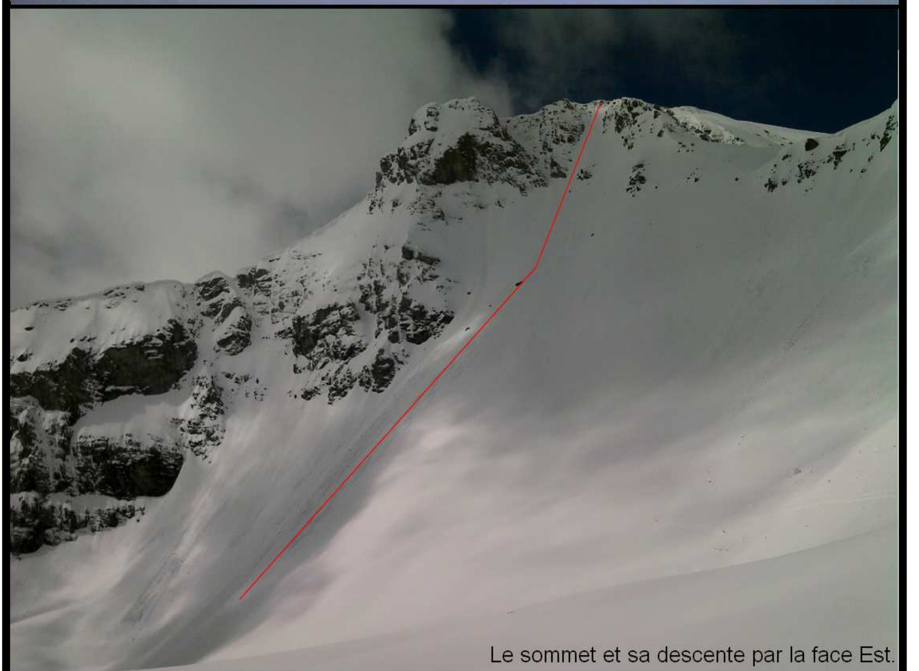
Le sommet et sa descente par la face Est.

Le Mont Pelat est le plus haut sommet du secteur à cheval entre haut Var et haut Verdon.